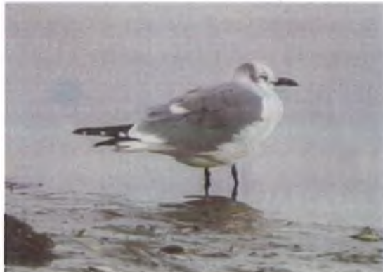
Yr wylan Chwerthinog, Porthmadog