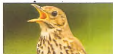
Y fronfaith – pencantores y wig

Dynwardwyr – ydach chi wedi meddwl pam bod rhai adar yn ddywardwyr mor dda? Wel, mae'r ateb yn syml – ac yn dwad 'lawr i'r un hen beth eto, sef sex , m'wn! Mae ieir rhai mathau o adar yn dueddol o ddewis y ceiliog efo'r amrywiaeth fwya o ganeuon. A'r rheswm am hynny ydi y gall ceiliog gymryd llawer iawn o amser i hel repertoire helaeth. Mae ceiliog sy'n gyfoethocach ei gân, felly, yn debygol o fod yn dderyn hyn a mwy profiadol fydd felly efo gwell amcan o sut i oroesi. A dyna mae'r iâr ishio yn hytrach na ryw brentis di-brofiad.