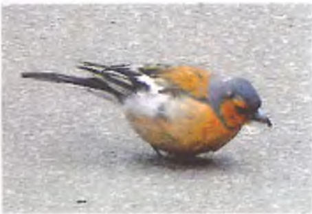
Ji-binc yn crffu am friwsionyn

Fel y rhan fwyaf o'r adar sy'n ymweld â'n byrddau adar yn ystod y gaeaf, mae'r ji binciaid yn gymysgedd o'r rhai sydd yma drwy'r flwyddyn â'r rhai sy'n ymfudo i Gymru o rannau eraill o Ewrop sy'n llai ffafriol iddynt dros y misoedd oer. Yn gyffredinol mae niferoedd y ji binc eleni yn ddigon tebyg i'r hyn a fuont y llynedd a'r flwyddyn cynt.