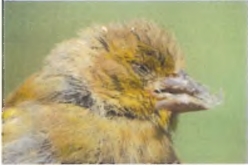
Llinos werdd yn diode o'r clwy Trichomonosis