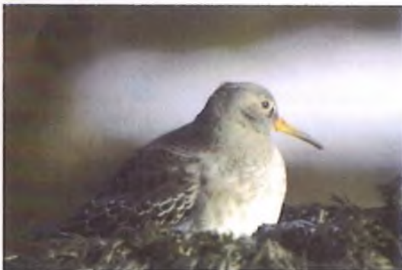
Pibydd du, Cemlyn