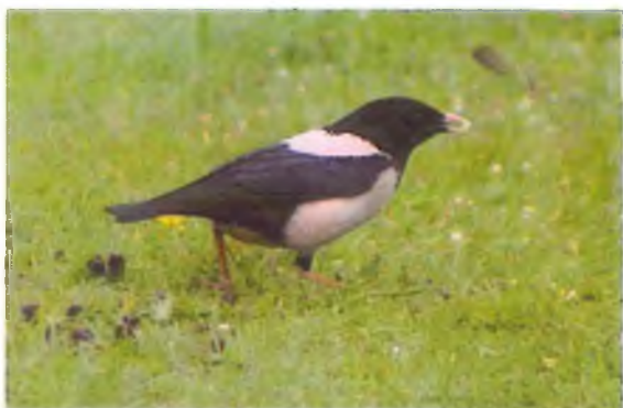
Drudwy Wridog Dyffryn