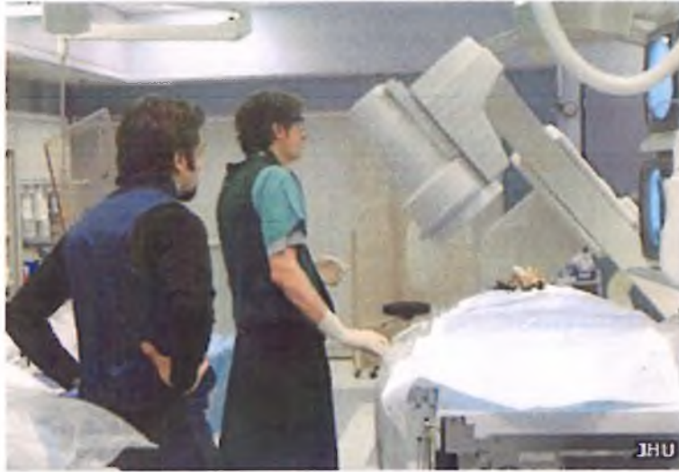
Sganio gwddw tylluan

Mi all tylluan droi ei phen rownd 270° heb iddi dagu ei hun na chwaith gau'r cyflenwad gwaed i'w phen a disgyn mewn llewyg oddiar y gangen! Sut, tybed, mae hi'n llwyddo i wneud hynny?