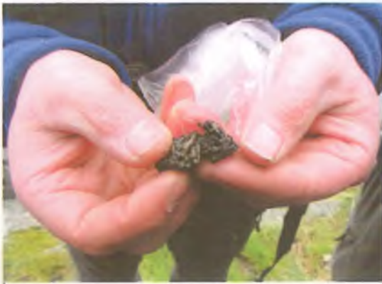
Rhys yn bachio baw dwrgi.