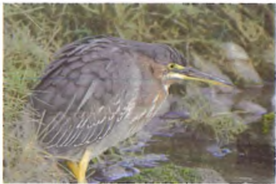
Creyr gwyrdd, Pentraeth