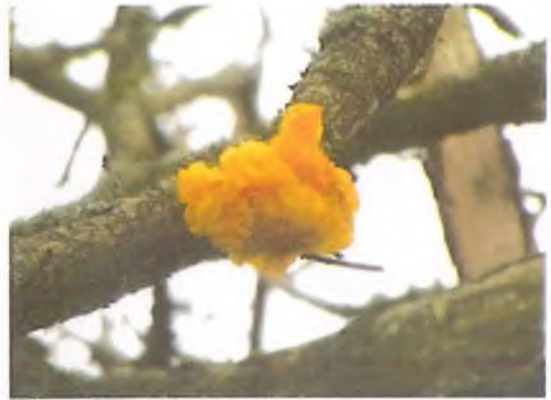
Na, ddim rhosyn melyn ond menyng wrach ( Tremella mesenterica )