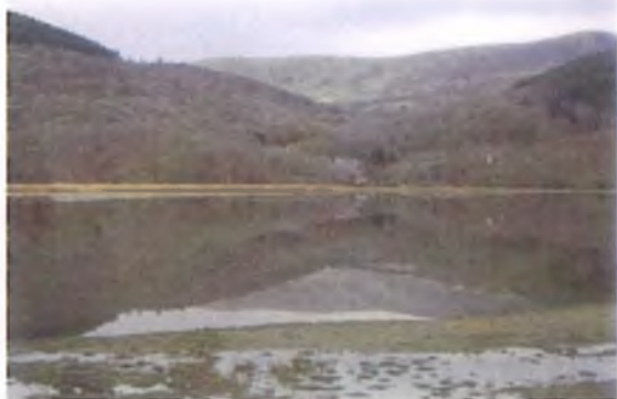
Adlewyrchiad perffaith o Gwm Mynach yn y Fawddach