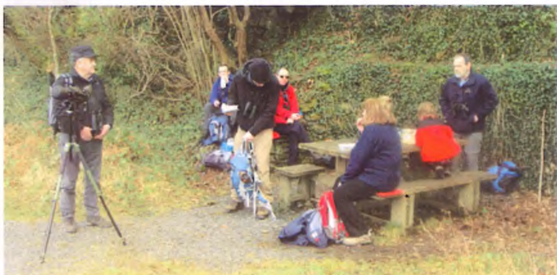
Amser cinio. Bwrdd picnic handi ar Lwybr Mawddach.