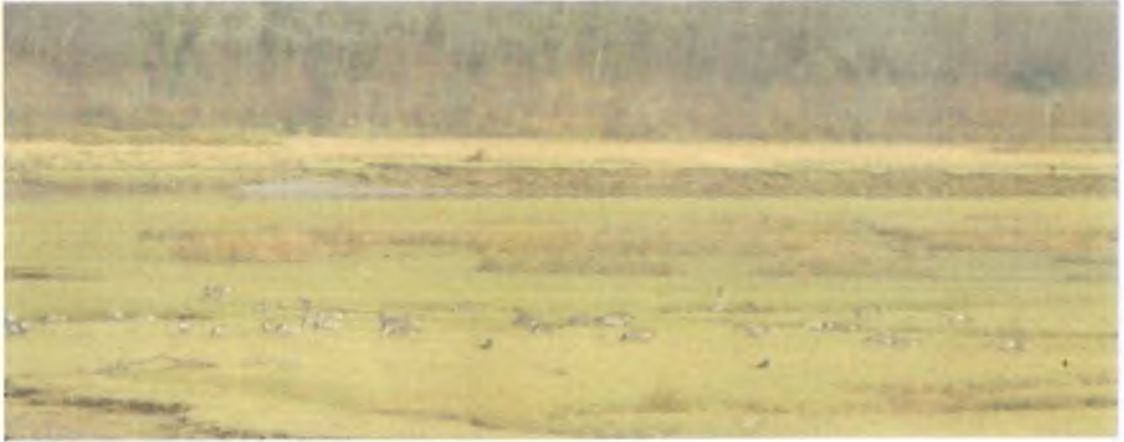
Haid o wyddau Canada yn difwyno porfa a mwd y morfa.