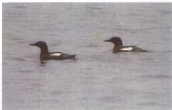
Gwylogod duon, Caergybi