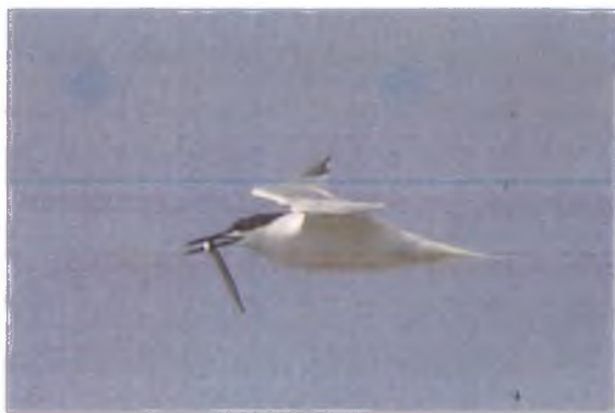
Morwenol bigddu, Cemlyn