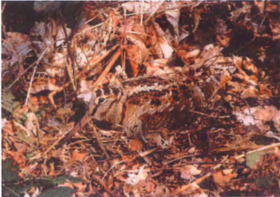
Welwch chi hi?! Iar cyfflog ar y nyth.

Efallai y bydd darllenwyr cyson Llygad Barcud yn cofio i mi dreulio gyda'r nos difyr dros ben yng nghrombil coedydd pîn coedwig Gwydir rai blynyddoedd yn ôl yn gwranddo ar y sŵn go ddiddorol. Ie, cyfflog oedd yno, yn rhodio uwch ei diriogaeth yn y gwyll, a hynny yn gwnud i mi anghofio artaith y gwybed mân. Eleni, byddaf yn mynd allan eto gan obeithio clywed yr un sŵn, y tro hwn i gyfrannu at arolwg y BTO o niferoedd bridio y cyfflog ym Mhrydain.