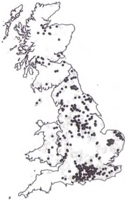
Data o 807 o sgwariau 1km 2 a arolygwyd yn 2003

Cynhaliwyd arolwg pwrpasol yn 2003, pan amcangyfrifwyd, yn dilyn gwaith ymchil penodol iawn, fod tua 78,000 o barau yn magu yma. Golygodd hyn anfon gwirfoddolwyr i sgwariau a ddewiswyd ar hap i gofnodi unrhyw adar a welwyd, cyn defnyddio ystadegau i gyfrifo'r ffigwr – gweler y linc yn y blwch isod am fanylion pellach.