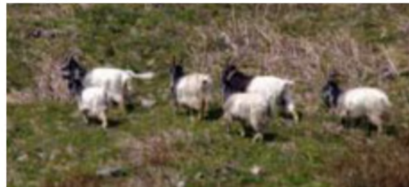
Gwir drigolion y fro

Yr wyf wedi ysgrifennu yn Llygad Barcud eisoes am fy sgwar BBS yma yn y cwm (un o dros 3,400 o sgwariau arolwg ym Mhrydain yn 2012. Gredwch chi mai dim ond yn un o dri o'r rheini y gwelwydd geifr gwylltion?! Dyna un ystadegyn diddorol o ganlyniadau arolwg 2012 – mynnwch gopi gan y BTO). Wel, heddiw dyma arwain criw bach Cymdeithas Ted ar hyd yr un llwybrau, a chael mwy o gofnodion gwerthfawr.