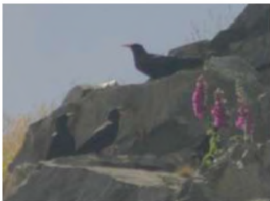
'Gwraag! – dwisho pry, pry'