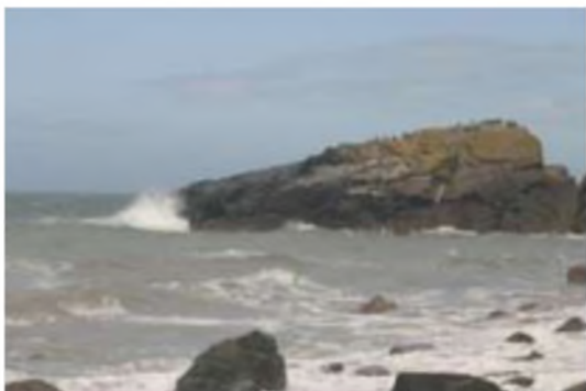
Llech Llydan dan ei sang â bilidowecars

gwylogod galore ; gwyfanod penwaig; cip ar ambell wylan goesddu fach osgeiddig ac un neu ddau o adar drycin y graig ar eu hadain ger wyneb y clogwyn yn marchogaeth y gwynt o'r môr.