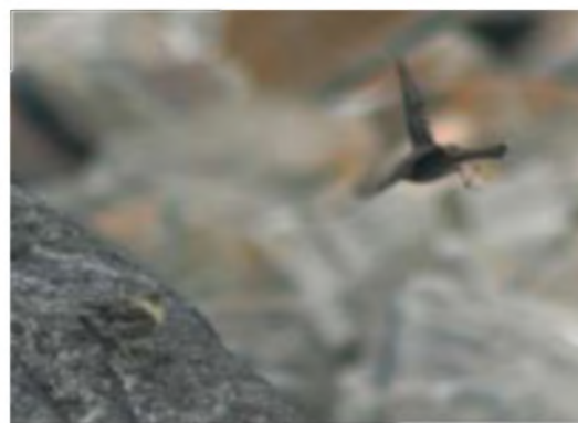
Cor-hedydd y graig a'i gyw (Ilun HD)

Mi oedd 'na gorhedydd y graig yno hefyd yn brysur yn bwydo'i gyw. Mi ddaeth pâr o frain coesgoch (brain picoch yn Llŷn) heibio ac mi glywson ni ddryw yn rhegi arnon ni o ymyl y clogwyn – on'd ydy'r drywod 'ma i'w gweld ym mhob man d'wch?