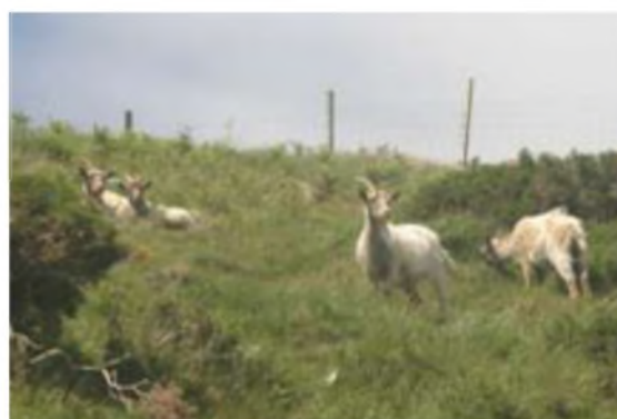
Be-e-e 'dach chi ishio'n fa'ma?

Ymlaen i gyfeiriad pen Carreg y Llam, a rhyfeddu at gyfoeth archeolegol y silff yma o dir – waliau crwydrol o gwmpas caeau hynafol a gwrymiau ar wyneb daear yn awgrymog o hen anneddau canol-oesol. Cyrraedd y pen draw a chael ein croesawu (?) gan yrr fechan o eifr – yr unig rai o ddisgynyddion hen drigolion Nant Gwrtheyrn sy' wedi cadw at eu cynefin.