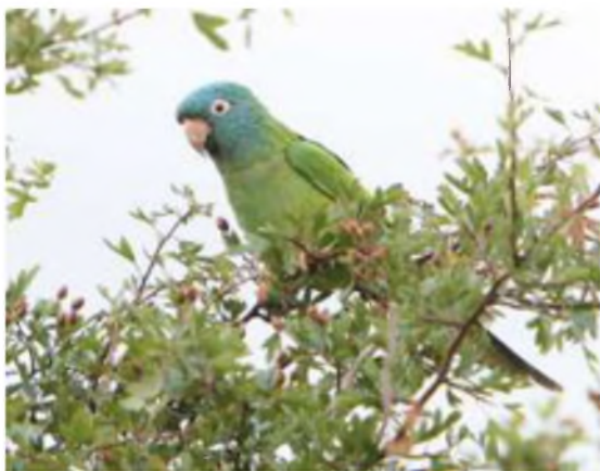
Paracit penlas

Mae 'na gofnodion parotiaidd eraill o'r ardal hefyd. Dair mlynedd yn ôl mi dynnodd Rory Trappe (sy'n gweithio yn Atomfa Traws) y llun isod o Baracit penlas ( Aratinga acuticaudata ) ym Mlaenau Ffestiniog.