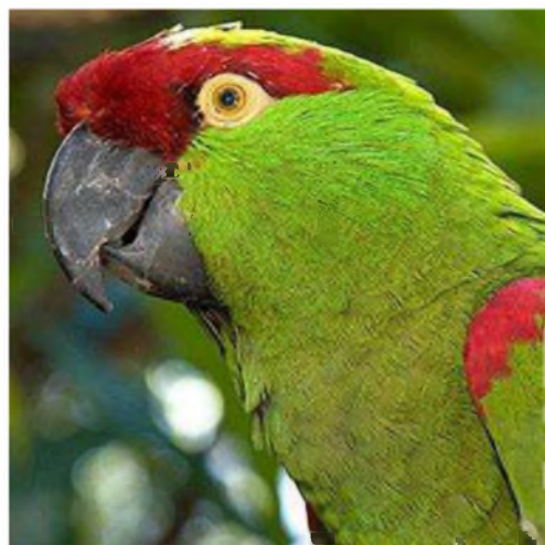
"Gwraaaaag! 'Da'mi gnau gen ti!?"

ar ôl yn y gwyllt erbyn hyn ac o'r rheiny amcanir mai dim ond ryw 100 o barrau sy'n llwyddo i nythu bob blwyddyn.