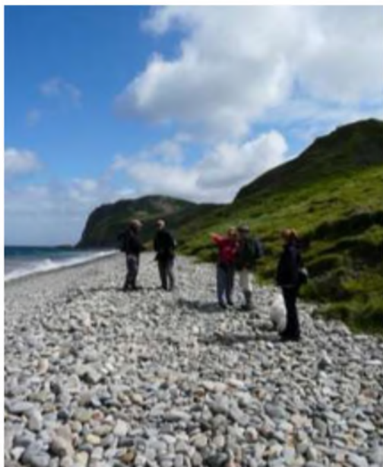
Traeth carregog Pistyll efo Carreg y Llam yn y pellter

Roeddem yn gweld hefyd pa mor ansefydlog ydy'r clogwynni pridd 'ma. Talp enfawr o dir fferm Pistyll, sy' o dan yr Eglwys, wedi llithro i'r môr rai blynyddoedd yn ôl ac amryw o fân lithriadau i'w gweld ar ein ffordd am Llech Llydan o dan Carreg y Llam. Doedd dim angen poeni – dim ond wedi cyfnod estynedig o law trwm i feddalur' ddaear mae'r lithriadau'n digwydd.