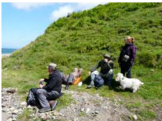
Lle cysgodol i ginio a Huw yn 'i hwyliau

Yn hytrach na aros am ddwyawr arall am y trai dyma ymlwybro'n ôl ryw faint a phicio i mewn i gysgod nant fechan am ein cinio. Ac mi oedd hi'n gysgodol iawn yno hefyd rhag y gwynt.