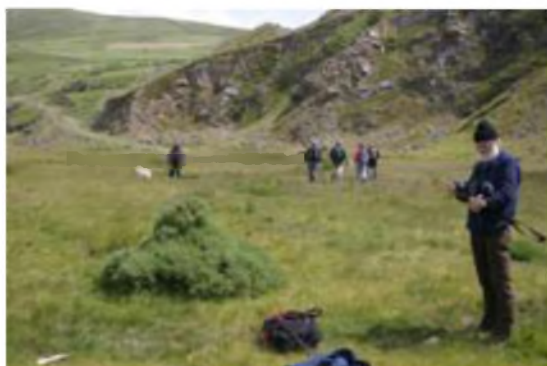
Na, does dim ishio weindio ffilm ymlael ar gamera digidol .....yn nagoes?

Troi'n ôl oedd y cam nesa, gan ddilyn y grib yn ein holau (ryw daith siap sosej).