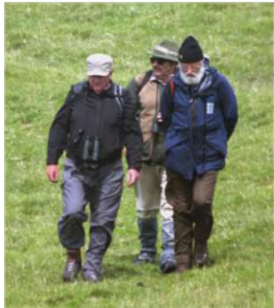
Y doethion dri, yn nannedd y gwynt

ni'n cyrraedd yn ein holau at y maes parcio. Amryw o adar cyffredin – llinosiaid, ji-binc, titw mawr, adar duon – ac yna, un cân i godi'r galon: nodau'r bras melyn o'r eithin, efo'i neges adnabyddus: 'Mae'n syn-iad reit dda i dd'eud pliiiiis'.