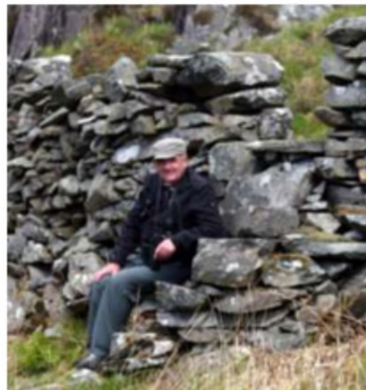
Ceidwad y gamfa: “Mond 50c yr un, plis”

Cymal bychan iawn ar y ffordd yn ôl at y ceir, a dyna ni ddiwedd cylchdaith amrywiol iawn o ran cynefinoedd - rhywbeth y gellir ei wneud yn hawdd yn Ardudwy gyda chymorth map ac ychydig o chwilfrydedd! Gallwn fynd ymlaen i sôn am y rali ceir rhwng waliau cerrig tal y fro, gemau agor giatiau, y tro heibio i Dyddyn Llidiart ar drywydd y troellwr bach, a phynctiar un o'r criw... ond gwell gadael pethau yn eu blas! Diolch i bawb a ddaeth ar y daith. Ers hynny bum yn ôl yn cwblhau ail hanner BBS eleni, a'r wybodaeth bellach ar ei ffordd i ffurfio cyfraniad fechan at adroddiad 2013. Rwy'n edrych ymlaen yn barod at y gwanwyn nesaf!