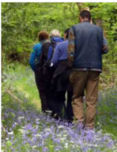
Hwp! Dau, tri, pedwar....

Lle hudol yw Ardudwy. Môr a mynydd, coedydd a ffriddoedd, a'r cyfan o fewn cyrraedd hawdd i'w gilydd. Mae cant a mil o lefydd diarffordd i ymweld a hwy, a phob un yn cynnig cyfoeth o adar, mewn ardal sydd heb ei difetha'n ormodol gan drachwant amaethyddiaeth modern. Heddiw roedd cyfle i fynd i fwy nac un lle. Cyfarfod ym mhentref Llanbedr i ddechrau, a rhannu ceir oddi yno. I fyny'r ffordd gul, a chymryd y fforch i'r chwith am Gwm Bychan i ddechrau. Nid i bellafion y cwm chwaith, ond yn hytrach i goedlan ar ochr ogleddol y ffordd.