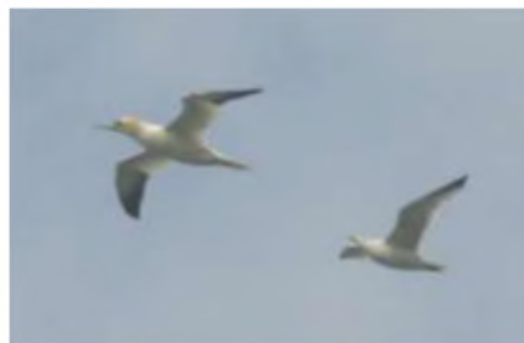
Hugan dan erledigaeth

swatio ymysg y cerrig ar ran ucha'r traeth, felly cadw at ymyl y dŵr oedd orau rhag ofn damwain – mae'u cuddliw nhw'n eu gwneud yn drybeilig o anodd i'w gweld dan draed.